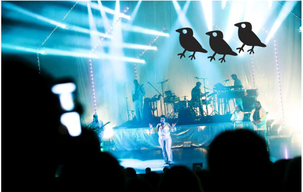
Det mesta satt när Seinabo Sey höll sin turnépremiär på UKK. Bilden är från ett tidigare tillfälle.

Så tycks Seinabo Sey också vara ett slags unikum när det kommer till lugn. Debuten, som började med den internationella hitlåten "Younger" och kulminerade med det utrustade debutalbumet "Pretend" år 2015, skapade en fallhöjd som hade skrämt de flesta. Men Seinabo Sey har, åtminstone utåt