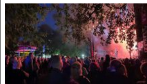
Fler artister till Gustavsvik i sommar. Här Albin Lee Meldau på scenen 2023.