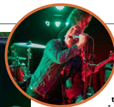
Bastardes på Grill & Grytas punkafton.

(Råttorna, Fou Parle) tar över micken och inleder ett nu för tiden ytterst sällsynt Iguana Party-gig. Hans register är väl kanske inte allt av vad det en gång var, men allt annat är det. Den melodiska finessen är intakt och skärpan i de 20–25 år gamla