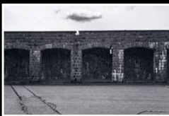
Mauthausen. Kombinerat arbets- och koncentrationsläger öster om Linz i Österrike. Verksamt från augusti 1938 till maj 1945.

► Läs en längre version av artikeln på barometern.se/kultur-noje