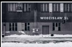
Väg 933, från Auschwitz-Birkenau, nuvarande Oświęcim, till järnvägsstationen Loslau, nuvarande Wodzisław Śląski, sydvästra Polen. Här gick en av många dödsmarscher under vintern 1945.