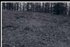
Gamla bränsledepåer utanför Vilnius, Litauen, där masskjutningar ägde rum från juli 1941 till juli 1944.