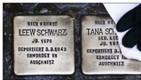
I Tyskland uppmärksammas offren efter Förintelsen med så kallade "snubbelstenar". Varje sten innehåller uppgifter om en person som miste livet till följd av nazisternas politik.