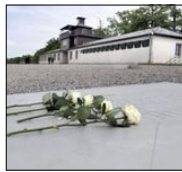
Fyra vita rosor framför koncentrationslägret i Buchenwald. Den 27 januari uppmärksammas minnet av Förintelsens offer.