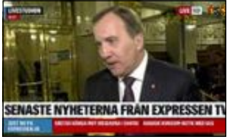
Statsminister Stefan Löfven i Expressen TV.