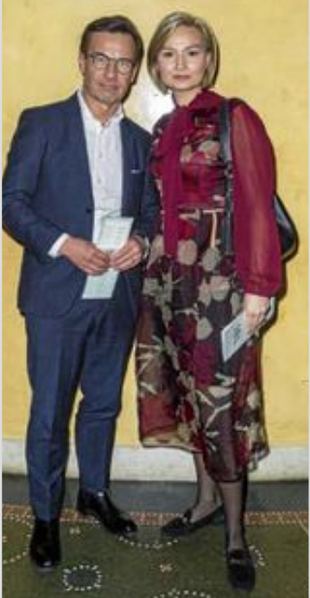
Ulf Kristersson, partiledare för Moderaterna.

”Det är så många med judisk påbrå som jag träffar som inte vågar vara den de är fullt ut på grund av den tilltagande antisemitismen. Som inte vågar bära Davids stjärna och det är för dem som jag vill vara ett stöd. Det är en mansålder sedan andra världskriget och det finns inte många kvar som kan berätta själva om Förintelsen.