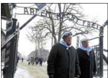
Förintelsemuseet Yad Vashem i Jerusalem.

”Med en pappa som har överlevt koncentrationslägret Mauthausen så finns ingen annan ställe jag hellre vill vara i dag än på detta minnesevent. Det handlar om att visa att detta är en viktig dag och att påminna om alla hemskheter som har hänt. Det får inte glömmas bort.