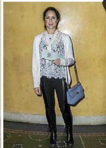
Skådespelaren Sara Sommerfeld.