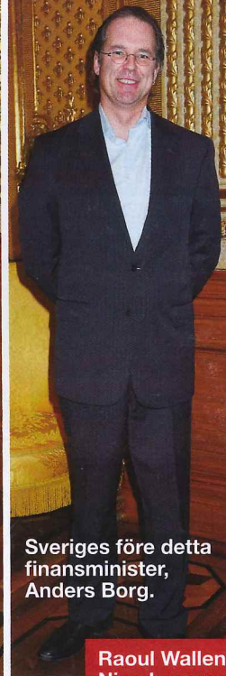
Sveriges före detta finansminister, Anders Borg.