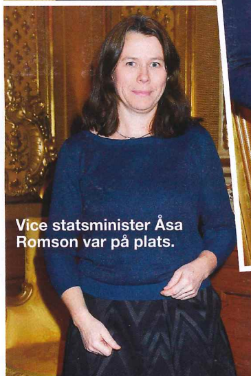
Vice statsminister Åsa Romson var på plats.