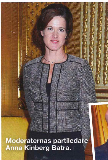
Moderaternas partiledare Anna Kinberg Batra.

Kronprinsessan tog sitt uppdrag på största allvar och strålade i en kapp från Day Birger et Mikkelsen.