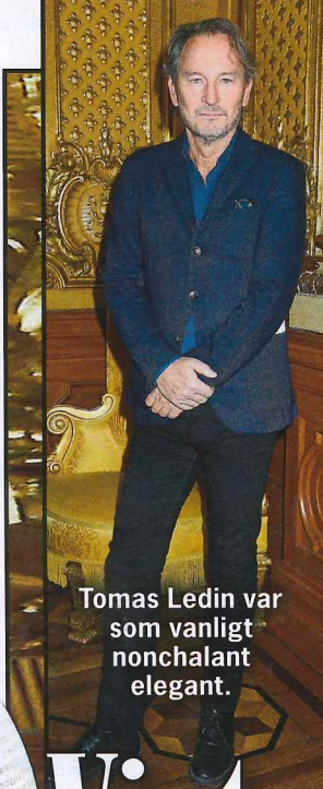
Tomas Ledin var som vanligt nonchalant elegant.