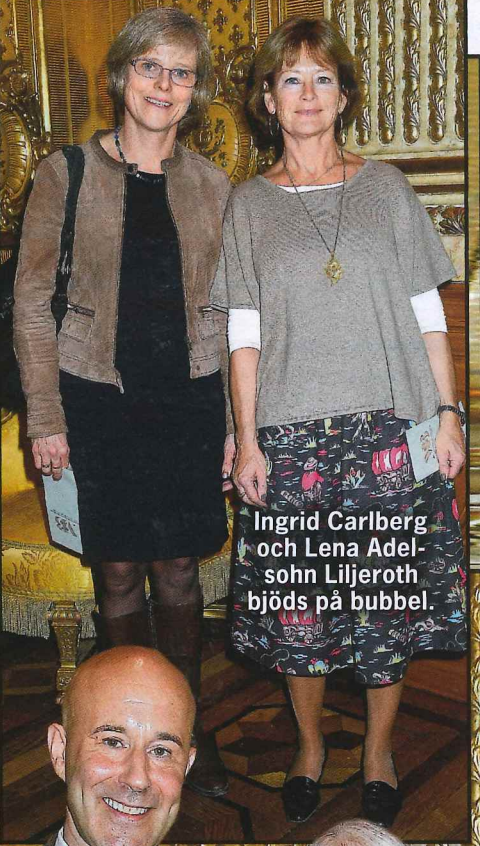
Ingrid Carlberg och Lena Adelson Liljeroth bjöds på bubbel.