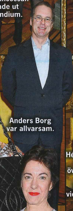
Anders Borg var allvarsam.