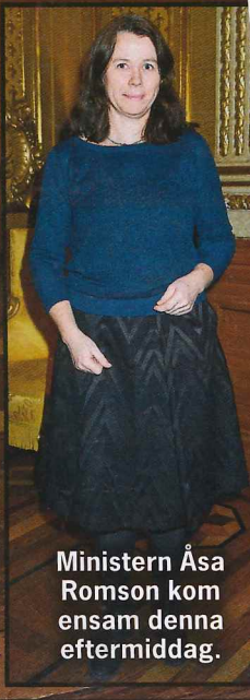
Ministern Åsa Romson kom ensam denna eftermiddag.