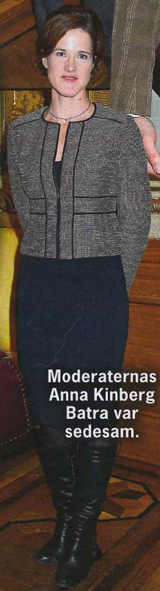
Moderaternas Anna Kinberg Batra var sedesam.