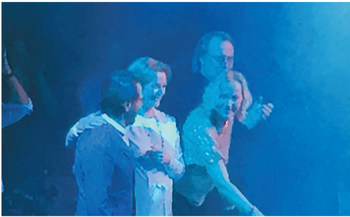
Hela Abba – Björn Ulvaeus, Anni-Frid Lyngstad, Agnetha Fältskog och Benny Andersson – tillsammans på scenen på Tyrol på Gröna Lund i Stockholm.