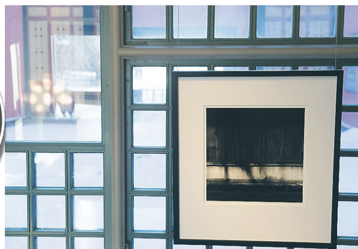
Fotografen Örjan Henriksson har fotograferat inne i Auschwitz.

Med tanke på Förin- telsens minnesdag den 27 januari har vi inte valt den utställ- ningen av en slump.