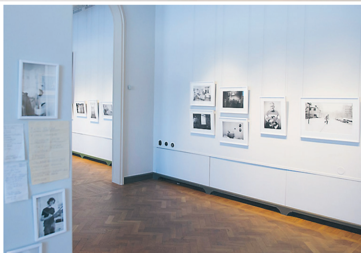
Johan Sundgrens bilder ger en inblick i ett vårdbiträdes vardag.