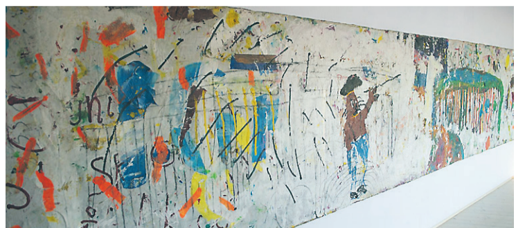
En uttrycksmetod prövas – och prövas igen i utställningen Sett Sätt Sitt.