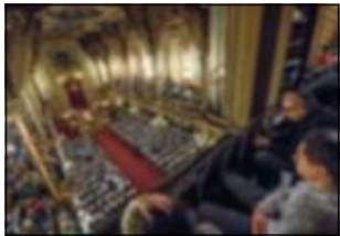
Stora Synagogan i Stockholm var välbesökt.

Mimmi Nilsson mimmi.nilsson@expressen.se