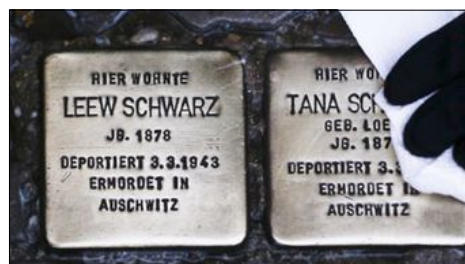
I Tyskland uppmärksammas offren efter Förintelsen med så kallade "sneubelstenar". Varje sten innehåller uppgifter om en person som miste livet till följd av nazisternas politik.