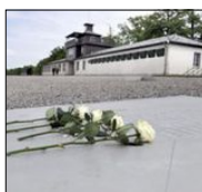
Fyra vita rosor framför koncentrationslägret i Buchenwald. Den 27 januari uppmärksammas minnet av Förintelsens offer.

UNDER DE TRETTON är som dagböckerna framställer arbetar han också med ett stort verk om den franska 1700-talslitteraturen. Det är tydligt att arbetet är nödvändigt för att hålla modet och livsandarna uppe. Skrivandet är också ett sätt att behålla sinnen, förnuftet, när omgivningen ter sig allt mer vansinnig. Men ju mer han arbetar med boken om nazisternas språk, desto mer försätter han sig själv och hustrun i fara, då han tvingas låna subversiv litteratur på biblioteket - så länge dessa lån är tillåtna av nazisterna.