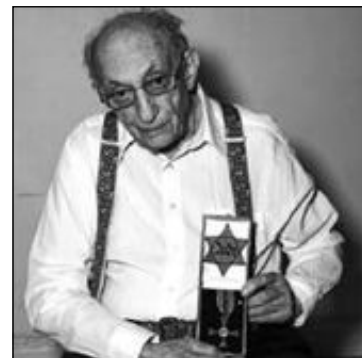
...likasom Walter Frankenstein.

– När vi kom till ett läger fick man antingen order om att gå till höger eller vänster. Jag fick gå till höger.