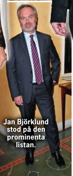
Jan Björklund stod på den prominenta listan.