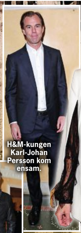
H&M-kungen Karl-Johan Persson kom ensam.