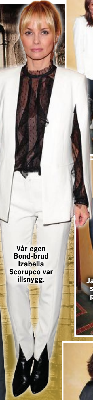
Vår egen Bond-brud Izabella Scorupco var illsnygg.