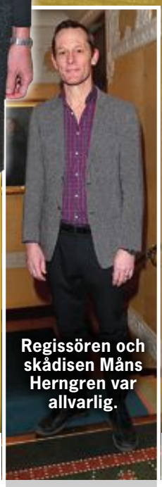
Regissören och skådisen Måns Herngren var allvarlig.