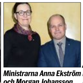
Ministrarna Anna Ekström och Morgan Johansson.