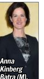
Anna Kinberg Batra (M).