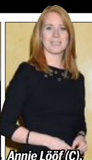
Annie Lööf (C).