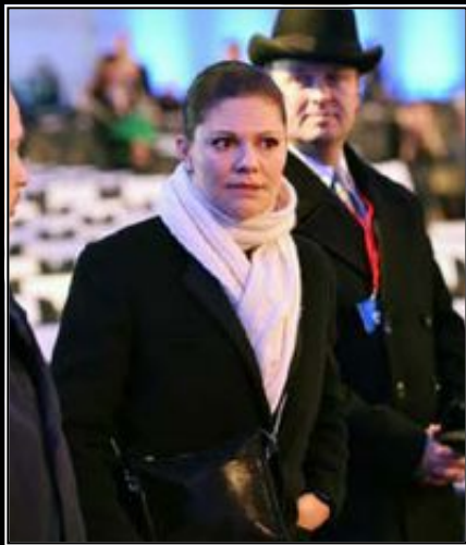
Victoria var på plats i Auschwitz under fjolårets minnesceremoni.