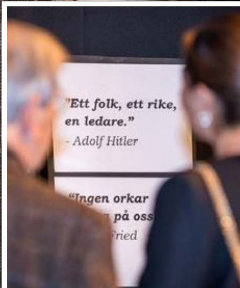
Victoria visade ett stort intresse för elevernas utställning om andra världskriget.