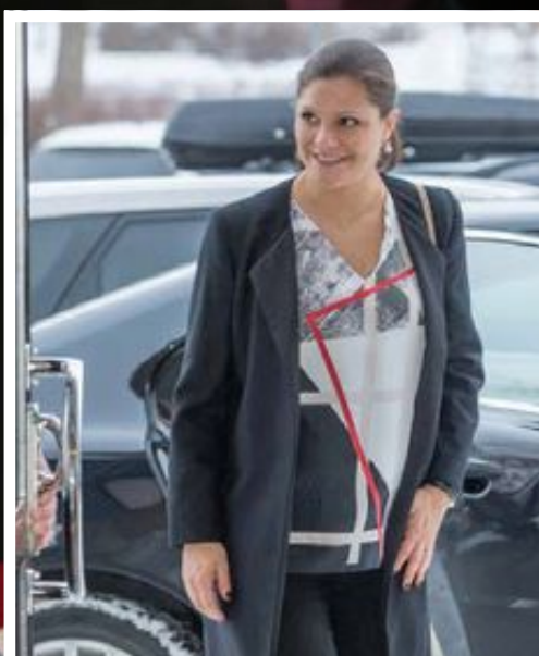
Kronprinsessan anländer till Viksjöskolan i Järfälla.