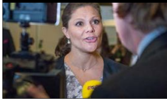
SE PÅ KVPSE. Kronprinsessan Victoria uppmanar alla att ta sitt ansvar.