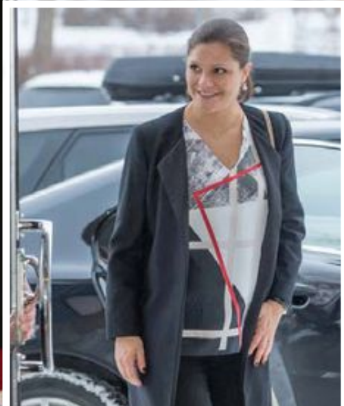
Kronprinsessan anländer till Viksjöskolan i Järfälla.