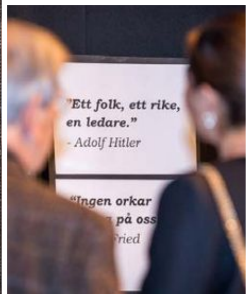
Victoria visade ett stort intresse för elevernas utställning om andra världskriget.