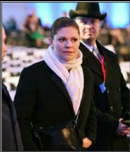
Victoria var på plats i Auschwitz under fjolårets minnesceremoni.