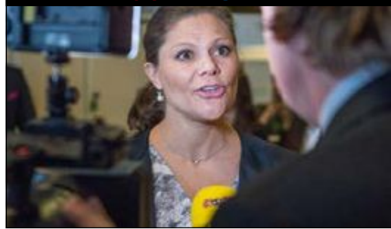
SE PÅ EXPRESSEN.TV. Kronprinsessan Victoria uppmanar alla att ta sitt ansvar.