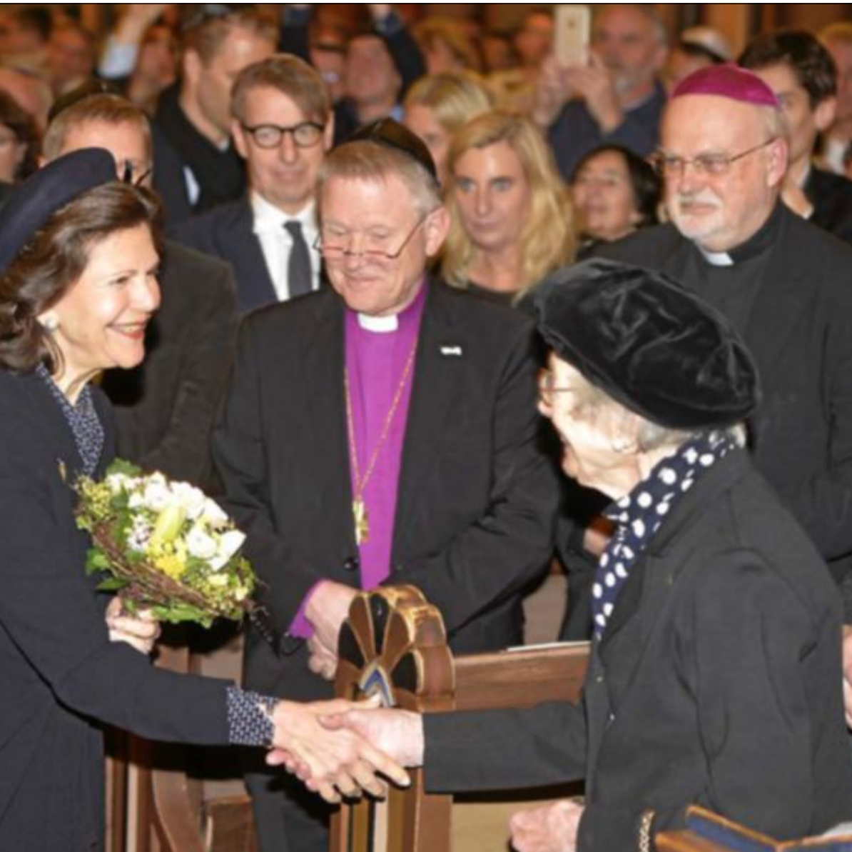
innan hon och kungen sedan satte sig på en av de första raderna i Stora Synagogan i Stockholm.