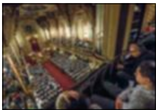
Stora Synagogan i Stockholm var välbesökt.