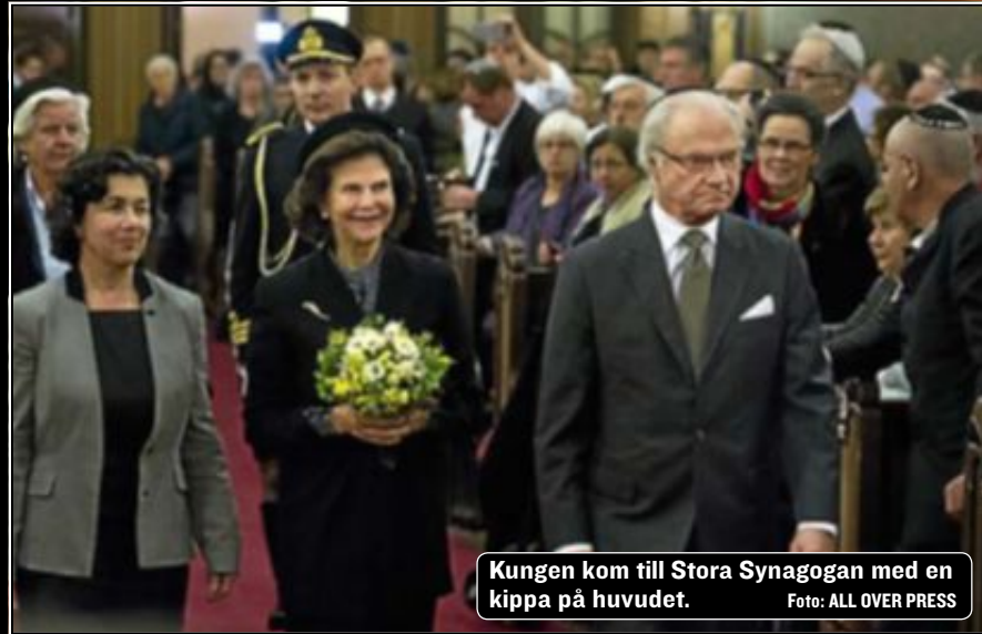
Kungen kom till Stora Synagogan med en kippa på huvudet.