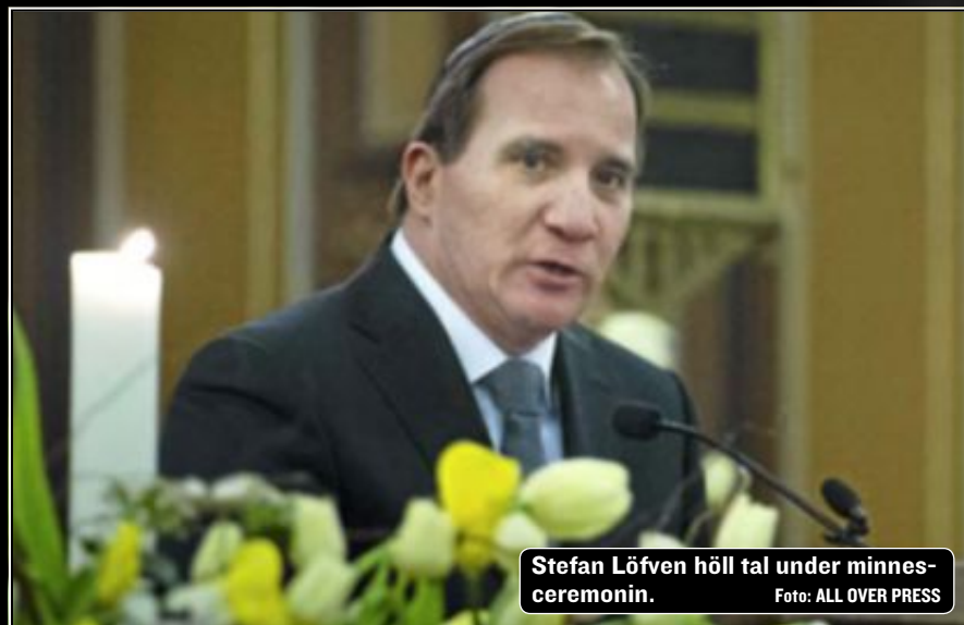
Stefan Löfven höll tal under minnesceremonin.