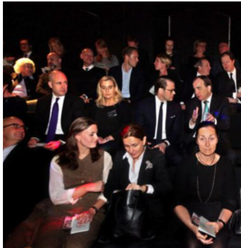
Politiker, näringslivstoppar samt kulturpersonligheter närvarade vid

Röster från minnesdagen. DN och Teater Galeasen anordnade nypremiär av pjäsen "Vår klass"