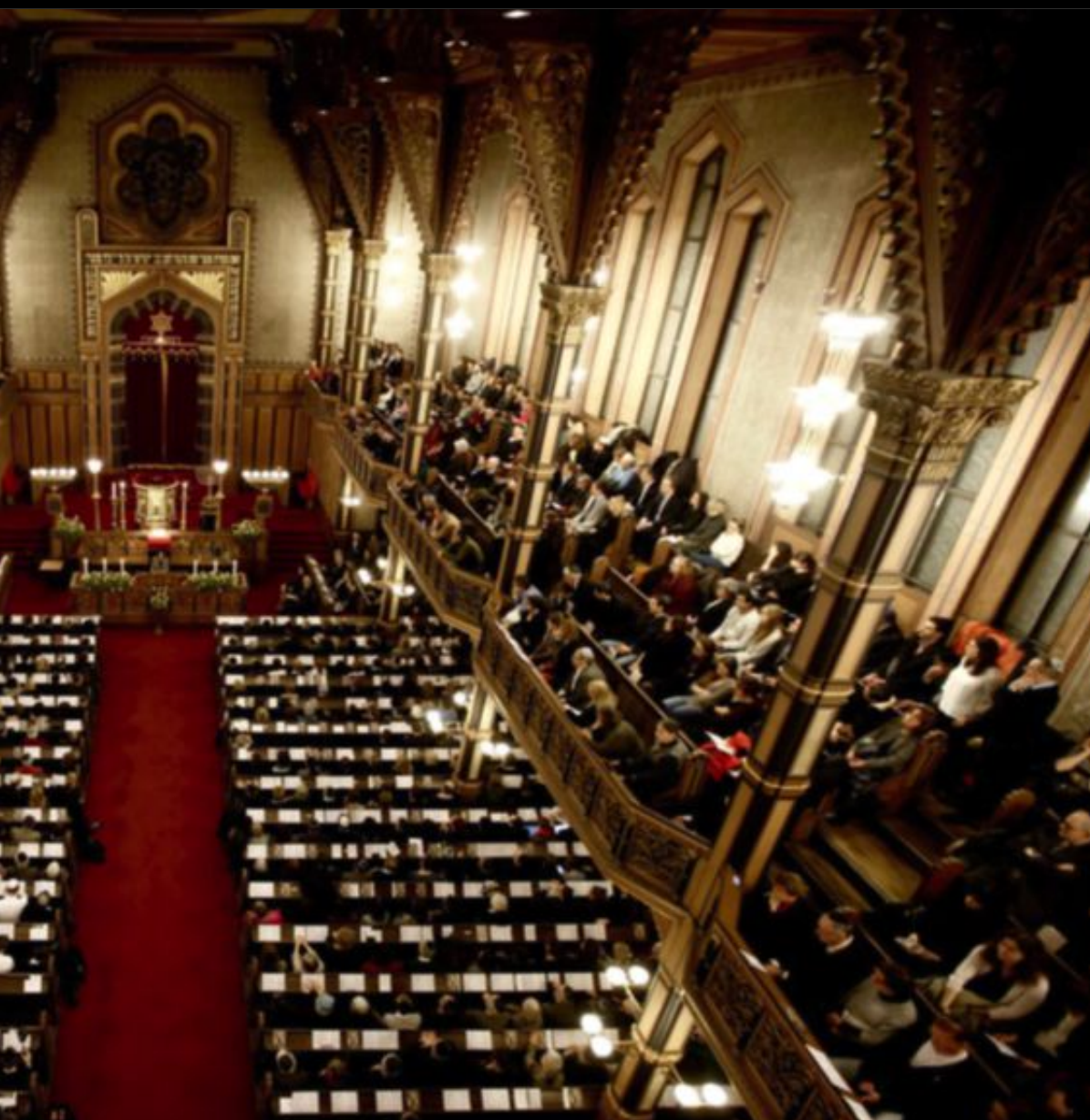
minnet av Förintelsens offer på tisdagskvällen.