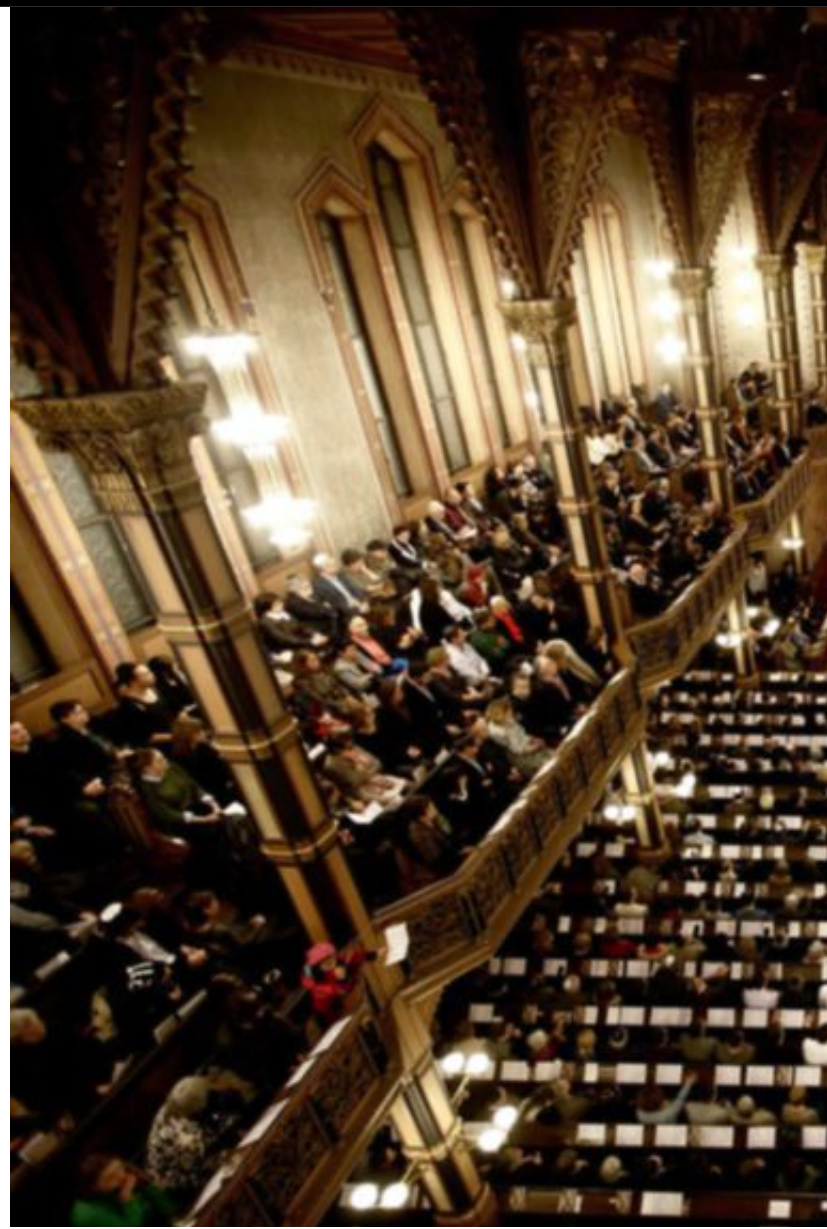
Stora synagogan i centrala Stockholm var fullsatt då det hölls en ceremoni till

– Jag ser ingen framtid för judiskt liv i Sverige eller i Europa. Men judarna är inte längre ett herrelöst folk. Vi har numera staten Israel. Aldrig mer ska vi behöva uppleva förintelse.