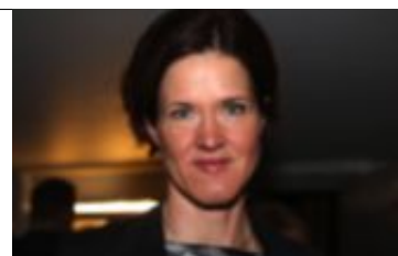
Anna Kinberg Batra , partiledare (M):

– Vi måste ärligt erkänna att vi har problem i vårt land, inte minst med antisemitism. Det är alldeles för många judar som bär vittnesbörd om trakasserier, hot och våld. Det är fullkomligt oacceptabelt.