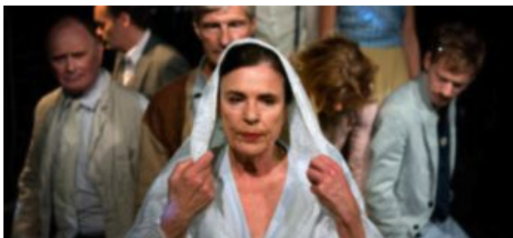
En scen ur pjäsen som hade nypremiär i går.