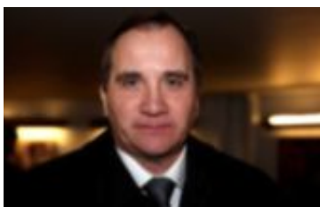
Stefan Löfven , statsminister (S):

Röster från minnesdagen. DN och Teater Galeasen anordnade nypremiär av pjäsen "Vår klass"