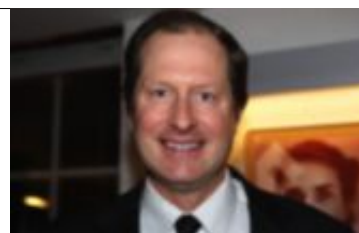
Mark Brzezinski , USA:s ambassadör i Sverige:

– Vi har inte gjort tillräckligt mot extremism och antisemitism. Alltför många i Sverige har inte velat se hur drabbad den judiska befolkningen är.