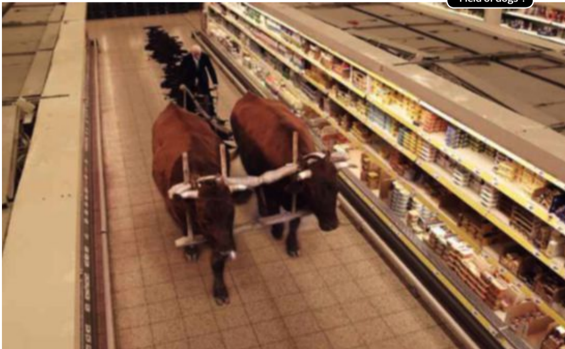
"Field of dogs".