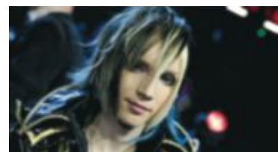
Yohio medverkar i kvällens program.