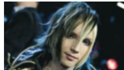
Yohio medverkar i kvällens program.