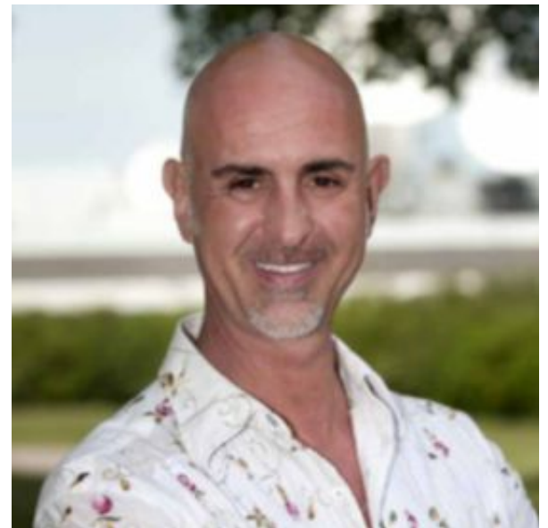
Pr-mannen startar en stiftelse för filmare, författare och andra kulturskapare.