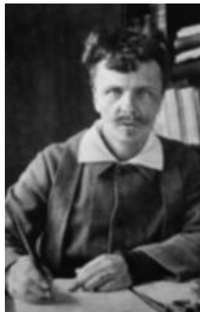
August Strindberg uppmärksammas i Kalmar i samband med nationaldagen.

- Vi försökte få den uppsatt, men det har inte lyckats ännu. Nu ska den