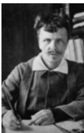
August Strindberg uppmärksammas i Kalmar i samband med nationaldagen.

- Vi försökte få den uppsatt, men det har inte lyckats ännu. Nu ska den